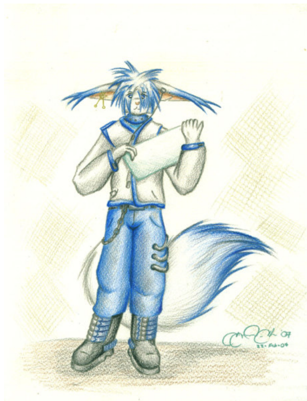
Imagen #2; Vulpes Praetor Fulmen III, forma Antropomórfica

(Imagen por el mismo autor // http://Sigmund-SL.deviantART.com )