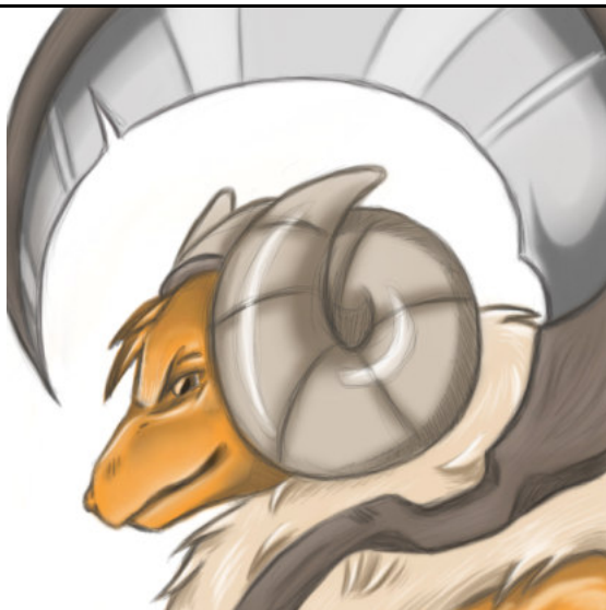
Imagen #6: Demonio Mayor, Baphomet