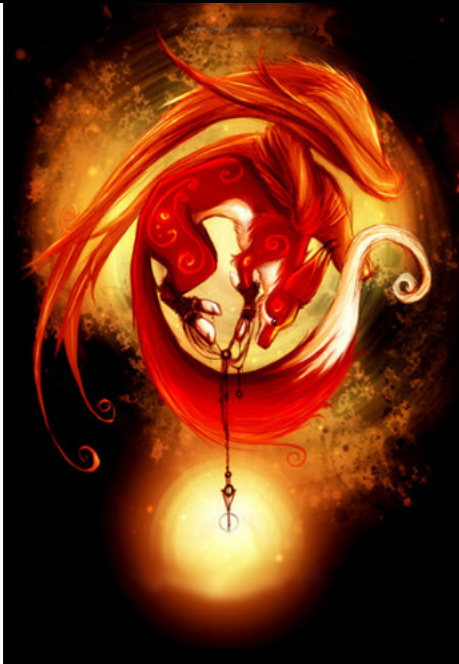
Imagen #4: Destructor Arcano Uggae Alla Xul